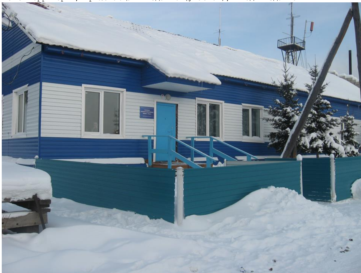
Фото Территория, прилегающая к зданию (участок), вход в здание