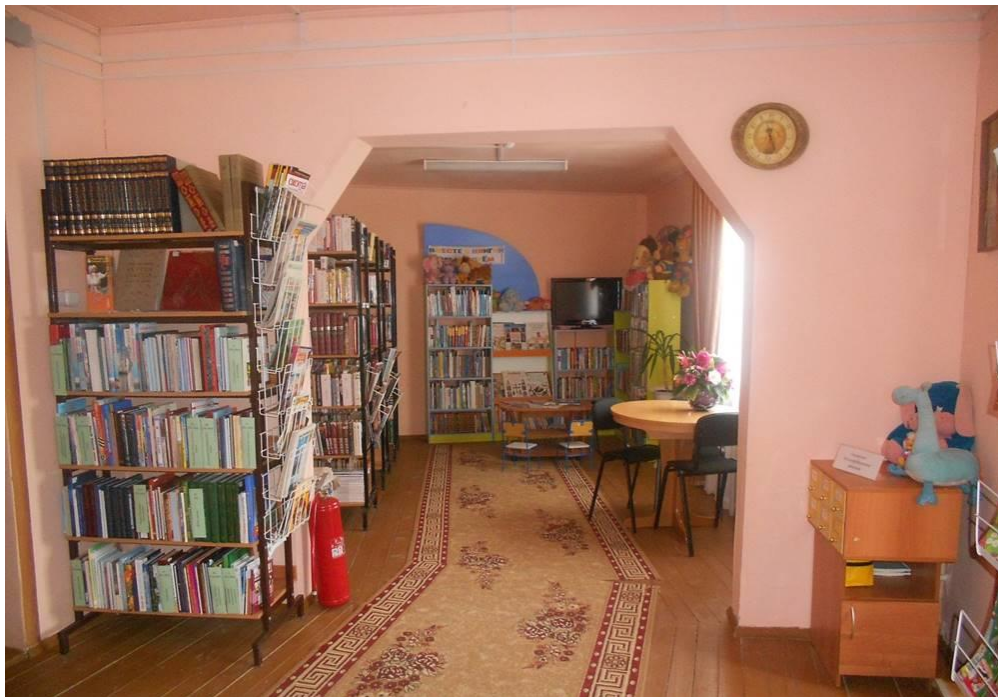
Фото 4 Зона целевого назначения здания (целевого посещения объекта)