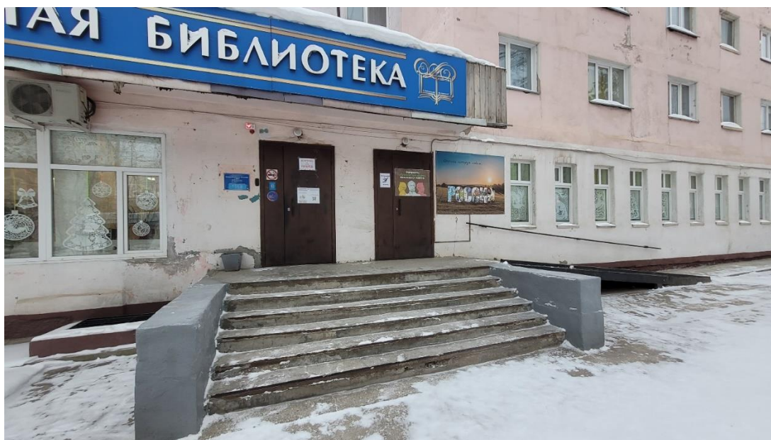
фото 2 (входы) в здание